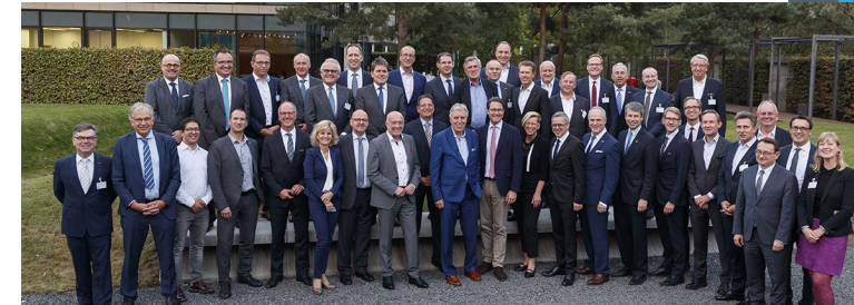
Ein starkes Netzwerk!