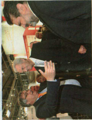
Der Bundesverkehrsminister lässt sich am Stand des Hafenlogistik-Buss über die Aktivitäten des Unternehmens unterrichten.